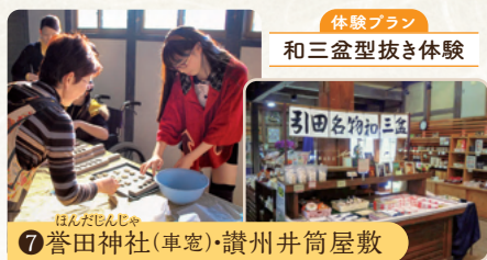
⑦ 誉田神社(車電)・讃州井筒屋敷

和三盆になる手前の白下糖づくりは、かつてさぬき市津田地区で行なわれていました。時代が変わっていく中、伝統を守るために製法を受け継いだ職人さんのお話を伺いし作業工程の説明を受けながら、工場見学します。 ※実際の作業は冬季シーズンの為、ツアー当日の作業見学はございません。