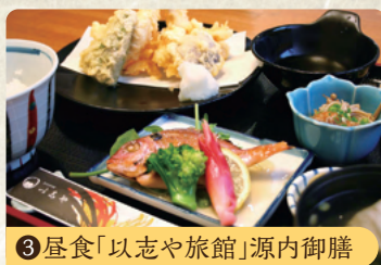
③ 昼食「以志や旅館」源内御膳