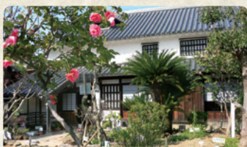
① 平賀源内旧邸・薬草園