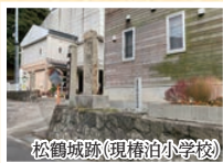
松鶴城跡(現椿泊小学校)