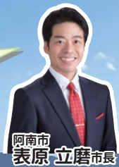
阿南市 表原 立磨市長

四国最東端に位置する阿南市は、海・山・川の自然に恵まれ、若杉山遺跡や阿波水軍などの由緒ある史跡と四国遍路のお接待文化が息づく一方で、LEDの世界的シェアを誇る地場企業があるなど、豊かな自然と文化、産業が鮮やかに調和したまちです。