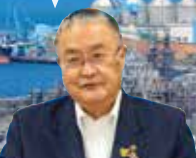
四国中央市 篠原 実市長

日本一の紙のまちを誇り、「パルプ・紙・紙加工品出荷額」、17年連続全国首位。具定展望台からの工場夜景は日本夜景遺産、日本夜景100選に認定。特産品は里芋、山の芋、水引細工、新宮茶など。産業の歴史や最先端技術など“日本一の紙のまち”四国中央市の魅力を、ぜひ体感してください。