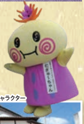
むぎゅ〜ちゃん 讃岐もち麦ダイシモチ公式キャラクター 普通寺市観光大使

「ダイシモチまんがなん学講座」を開催。ダイシモチの家系や栄養満点レシピについて学びます。