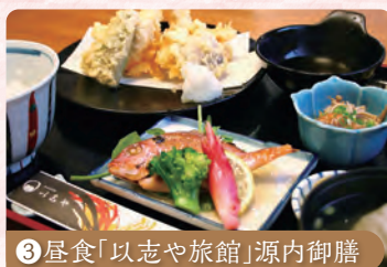
③ 昼食「以志や旅館」源内御膳

源内の多彩な業績を展示する記念館を見学し、その足跡をたどります。エレキテルも実際にご覧いただけます。