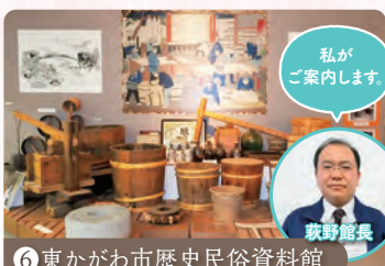
⑥ 東かがわ市歴史民俗資料館

東かがわ市の地場産業のほか、地域の歴史・民俗に関する資料が展示された資料館。砂糖づくりに必要な道具などを見ることができます。