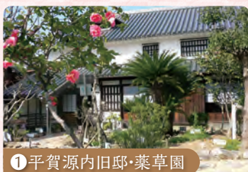
① 平賀源内旧邸・薬草園