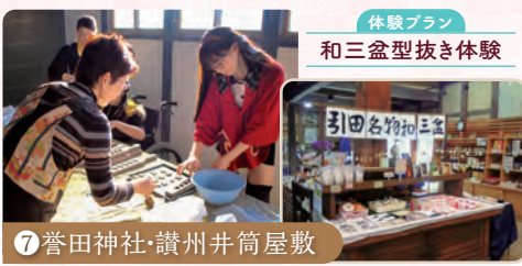
⑦ 誉田神社・讃州井筒屋敷

東かがわ市の地場産業のほか、地域の歴史・民俗に関する資料が展示された資料館。砂糖づくりに必要な道具などを見ることができます。