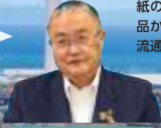
四国中央市 篠原 実市長

日本一の紙のまちを誇り、「パルプ・紙・紙加工品出荷額」、16年連続全国首位。具定展望台からの工場夜景は日本夜景遺産、日本夜景100選に認定。特産品は里芋、山の芋、水引細工、新宮茶など。産業の歴史や最先端技術など“紙のまち”四国中央市の魅力を、ぜひ体感してください。