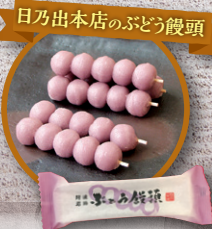
日乃出本店のぶどう饅頭