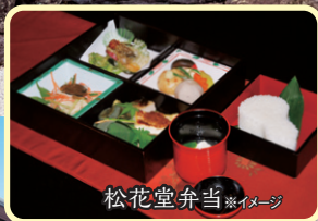
松花堂弁当 ※イメージ

828年(天長5年)、僧惠運が真言の道場として開創。吉野川を望む高台にあり、阿讃山脈、吉野川を借景とした枯山水(日本庭園)を見ながら、住職のお話と松花堂弁当をお楽しみください。