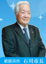
新居浜市 石川市長

新居浜市は世界有数の産出量を誇った別子銅山の開坑以来、銅(あかがね)のまちとして発展してきました。今回は、自然と共存し、工業都市として発展してきた新居浜市の魅力を歴史とともに紐解いていく内容となっています。観光として楽しみながらも、先人の想いや史実を通して、未来に繋がるSDGsのヒントも得られる学びの多い旅となると期待しております。