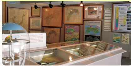
研究史コーナー (各地質図の変遷)