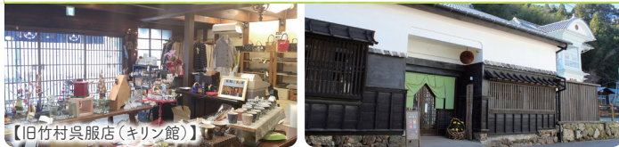
【旧竹村呉服店 (キンリン館)】

【旧浜口家住宅】 築約160年、江戸中期より酒造業を営み栄えた商家の住宅。現在はさかわ観光協会が地元のお土産販売や古民家カフェを運営。【竹村家住宅】 江戸時代より造り酒屋として栄えた佐川屈指の商家。国指定重要文化財に指定されています。