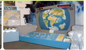
動く大陸装置 (プレートテクトニクス)