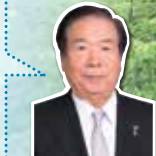
観音寺市長 白川 晴司

香川県最西端に位置する観音寺市は、天空の鳥居をはじめとする数々の名所に出会えるまちです。先人たちが築き上げてきた歴史や文化に触れて、本市の魅力を感じてください。