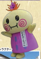
むぎゅ〜ちゃん 讃岐もち麦ダイシモチ公式キャラクター 普通寺市観光大使

「ダイシモチまんが 学ぶ講座」を開催。ダイシモチの家系や栄養満点レシピについて学びます。