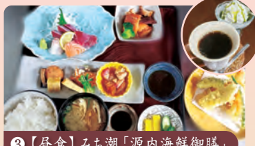
③【昼食】みち潮「源内海鮮御膳」

源内の多彩な業績を展示する記念館を見学し、その足跡をたどります。エレキテルも実際にご覧いただけます。