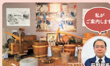
④ 東かがわ市歴史民俗資料館

津田湾が目の前に広がる眺めのいい海鮮料理店にて、新鮮な海産物を使用したお食事をお楽しみいただけます。和三盆を使ったデザートつき!