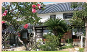
① 平賀源内旧邸・薬草園