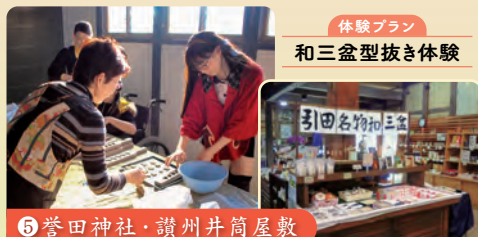
体験プラン 和三盆型抜き体験

東かがわ市の地場産業のほか、地域の歴史・民俗に関する資料が展示された資料館。砂糖づくりに必要な道具などを見ることができます。