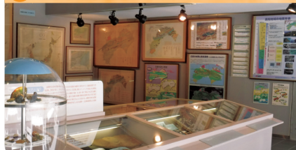
研究史コーナー(各地質図の変遷)