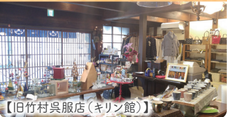
【旧竹村呉服店(キリン館)】