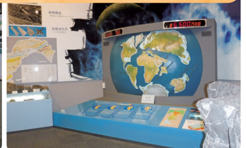
動く大陸装置(プレートテクトニクス)