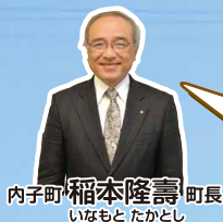
内子町 稲本隆壽 町長 いなもと たかとし

内子町は歴史や伝統、文化が豊かで、農村 景観も素晴らしい町です。中でも石畳 地区は郷愁と癒しを感じて頂ける場所 です。先人から受け継ぎ、大切に育んできた 美しい景観をお楽しみ下さい。