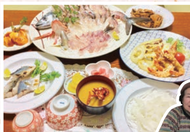
ゆきや荘・椿泊名物 昼食 「阿波水軍海賊料理」