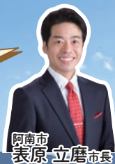
阿南市 表原 立磨 市長

四国最東端に位置する阿南市は、海・山・川の自然に恵まれ、若杉山遺跡や阿波水軍などの由緒ある史跡と四国遍路のお接待文化が息づく一方で、LEDの世界的シェアを誇る地場企業があるなど、豊かな自然と文化、産業が鮮やかに調和したまちです。