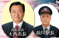
高松市長 大西市長

高松市は、北は多島美を誇る海の国立公園、瀬戸内海に面し、南は讃岐山脈を臨む、風光明媚で温暖な瀬戸の都です。高松港からフェリーで約20分に位置する女木島は、別名「鬼ヶ島」と呼ばれ、鬼の伝説が伝わる鬼ヶ島大洞窟や瀬戸内海を360度見渡せる展望台等、島ならではの見どころが満載です。ゆったりとした島時間をお楽しみください。