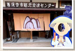
4 善通寺市 観光交流センター