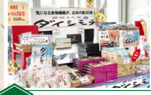
5 まんでがん・おしゃべり広場