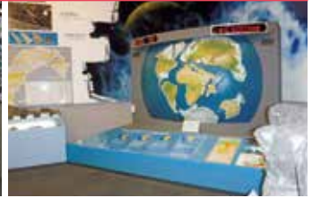
動く大陸装置(プレートテクトニクス)