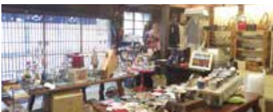
【旧竹村呉服店(キリン館)】