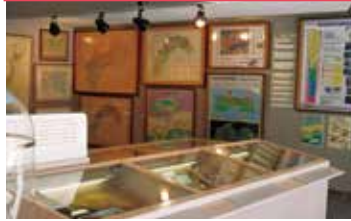
研究史コーナー(各地質図の変遷)