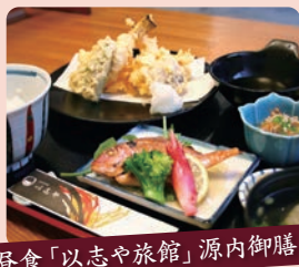
昼食「以志や旅館」源内御膳

有形文化財に登録された明治創業の旅館で「平賀源内」にまつわる料理を楽しめます。(メニューはイメージです)