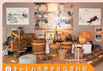
⑥ 東かがわ市歴史民俗資料館

東かがわ市の地場産業のほか、地域の歴史・民俗に関する資料が展示された資料館。砂糖づくりに必要な道具などを見ることができます。