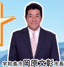
宇和島市岡原文彰市長

吉田藩は、宇和島藩より分知され風格ある武家屋敷や豪壮な商家が立ち並ぶ御陣屋町を形成していきました。また、吉田町は愛媛県下における温州みかん栽培の発祥の地と言われております。美しい自然風景や武家・商家の歴史をお楽しみ下さい。