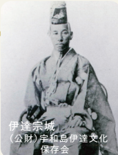
伊達宗城 (公財)宇和島伊達文化保存会