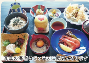
写真の海老はじつに天に変わるとなりませう

宇和島藩7代藩主・伊達宗紀が隠居の場所として建造した池泉廻遊式庭園。昼食は、園内のレストラン「美味美園天赦園」にて宇和島の郷土料理「鯛めし+じゃこ天」をいただきます。