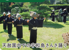
天赦園内での宇和島さんさ踊り