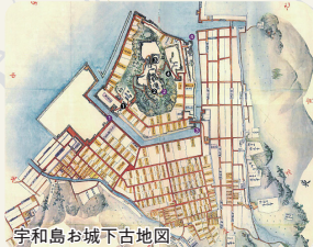
宇和島お城下古地図