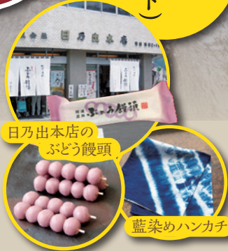
日乃出本店のぶどう饅頭

828年(天長5年)、僧惠運が真言の道場として開創。吉野川を望む高台にあり、阿讃山脈、吉野川を借景とした枯山水(日本庭園)を見ながら、住職のお話と精進料理をお楽しみください。