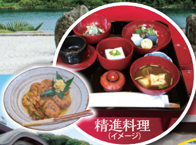
精進料理 (イメージ)