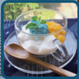
藍スイーツ(杏仁豆腐美馬ブルー生クリーム添え)のお接待

江戸中期～昭和初期の伝統的建造物が立ち並び、藍商人たちの繁栄を今に伝えるうだつの町並み。ガイドと一緒に古地図片手に、豪商気分でご散策しましょう。