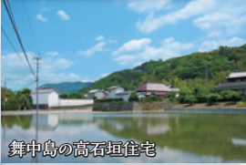
舞中島の高石垣住宅