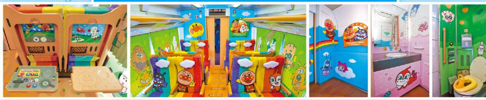
▲座席テーブルを開けると、ミニ運転席が現れるよ! ※進行方向により、7・10番席のテーブルには裝飾はございません。